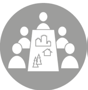
MÍSTNÍ AKČNÍ SKUPINA