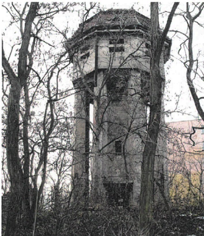
Vodárenská věž u železničního nádraží.

„V prvé řadě bude zapotřebí udělat nejnútější opravy hlavně střechy, aby do objektu nezatékalo. Zároveň se musí zbudovat odvod dešťových vod a zabezpečit stavbu proti vnik-